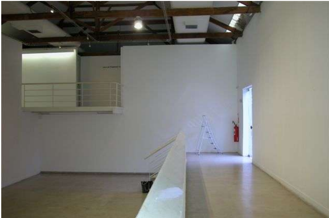
Fig. 7: galeria, mezanino e acesso ao museu (parede reservada a exposições do acervo do MUnA) – obs.: no lugar da escada dobrável funciona a recepção