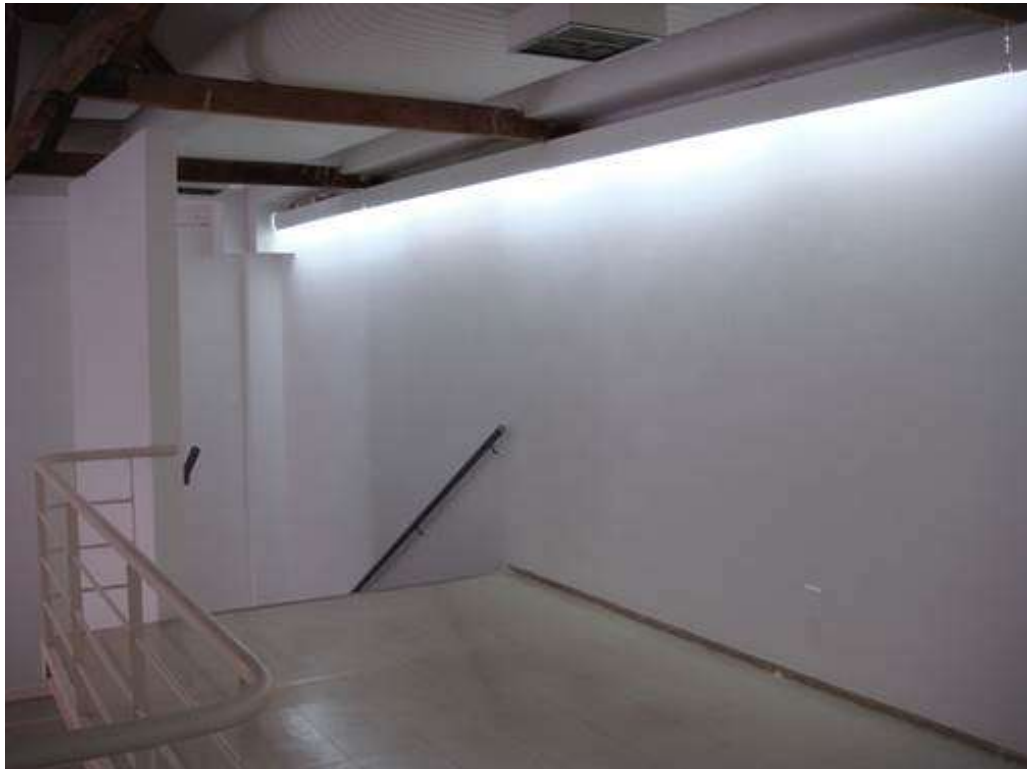
Fig. 11: mezanino