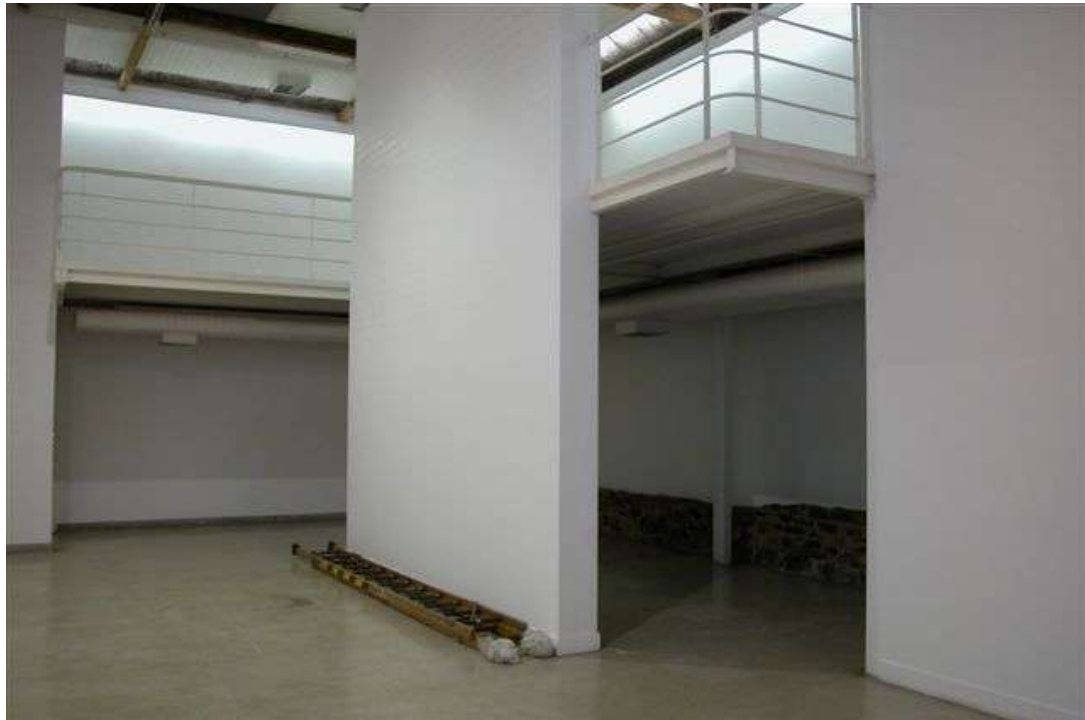
Fig. 9: galeria e mezanino