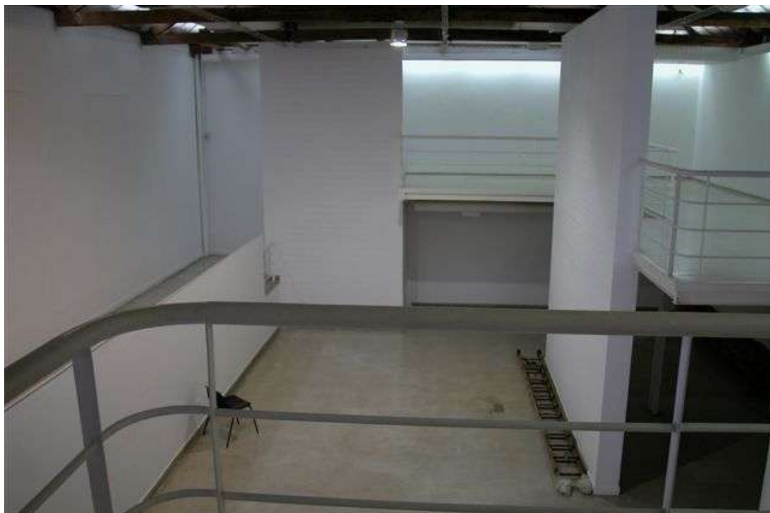
Fig. 10: galeria e mezanino