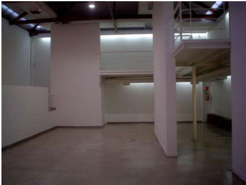
Fig. 6: galeria e mezanino