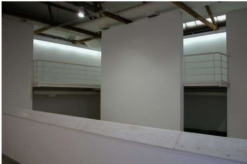
Fig. 3: galeria e mezanino a partir do acesso ao museu