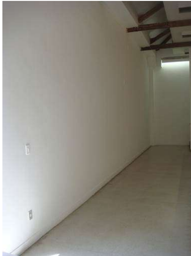
Fig. 13: mezanino