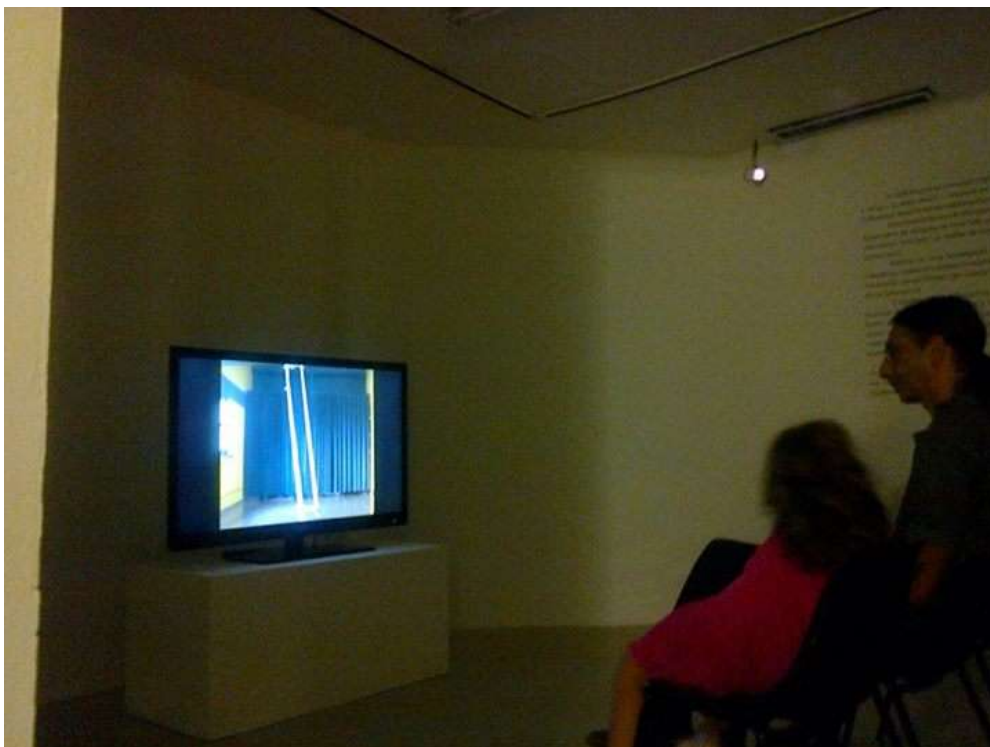
Fig. 16: sala Lucimar Bello em uso para exposição de videoarte, maio de 2015.