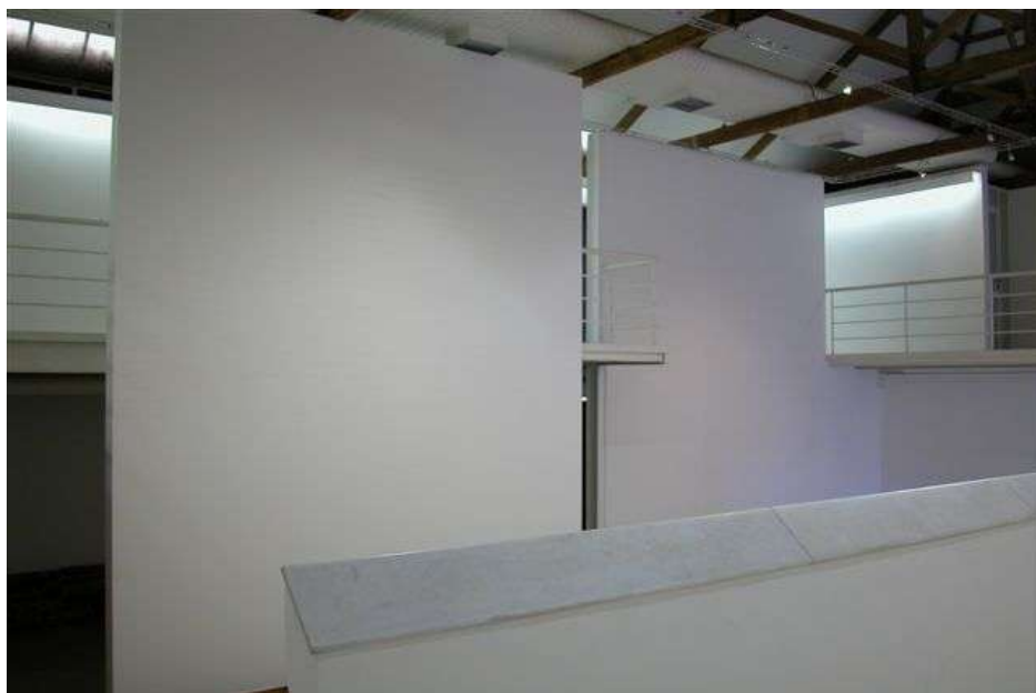
Fig. 4: galeria e mezanino