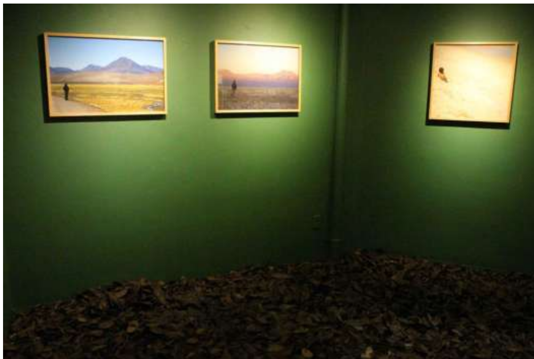
Fig. 17: sala Lucimar Bello em uso da exposição “Abismos contemplativos da memória”, da artista Heloísa Junqueira, maio de 2015 (obs.: neste caso, a pintura verde das paredes foi feita por conta da artista, que ao término da exposição repintou as paredes de branco)