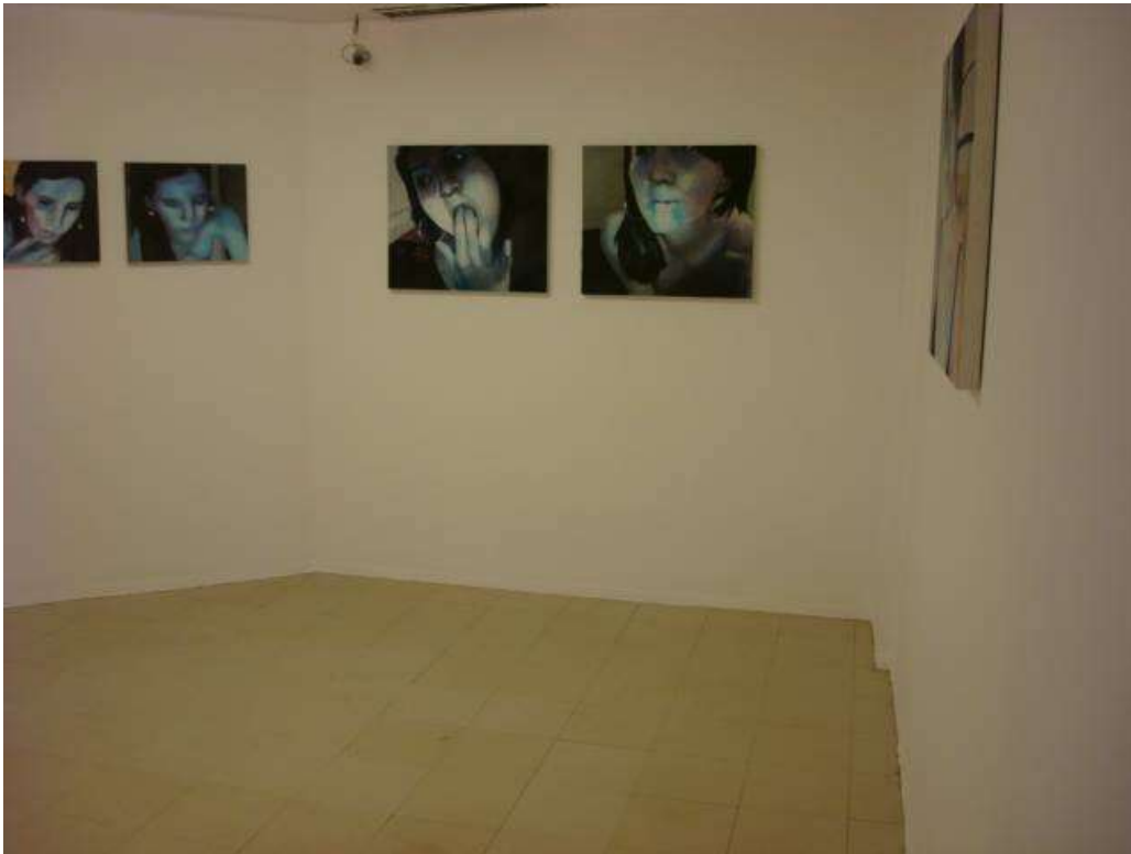
Fig. 15: sala Lucimar Bello em uso de exposição pinturas, novembro de 2013 (obs.: a pintura padrão da sala é na cor branca, conforme a fotografia)