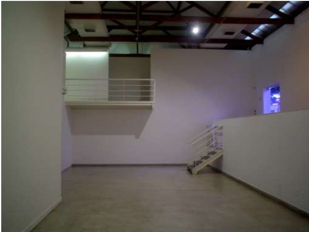
Fig. 5: galeria, mezanino e entrada do museu