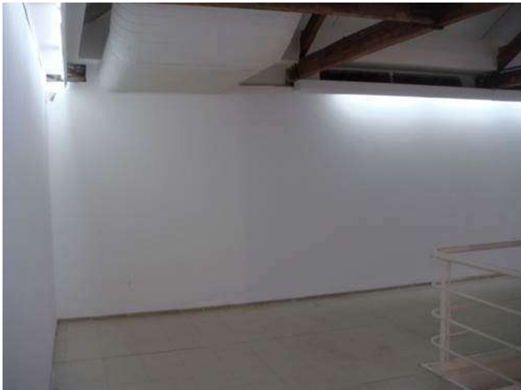
Fig. 12: mezanino