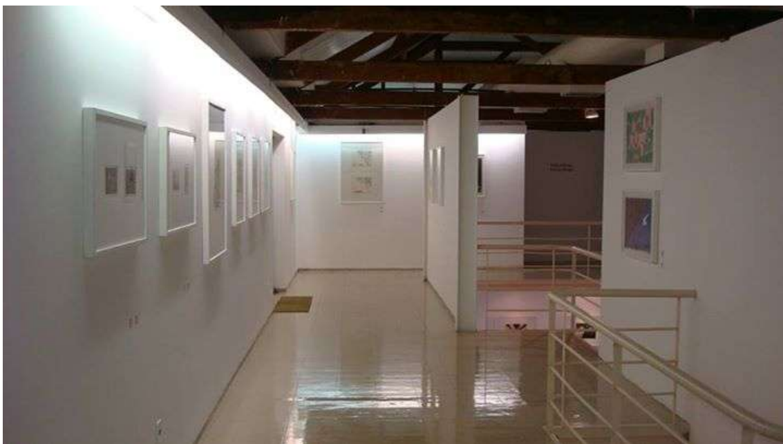
Fig. 14: mezanino em uso da exposição "Variações e afinidades" e acesso para a sala Lucimar Bello (à direita na foto), maio de 2014