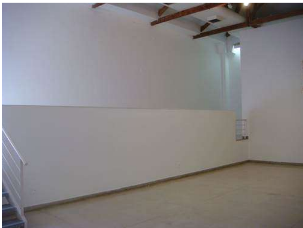
Fig. 8: galeria e parede reservada a exposições do acervo do MUnA